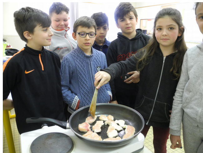
Dégustation comparée à l'école Alphonse Daudet de Castelnaudary.

environnemental et sanitaire et, bien sûr, rencontres sur les fermes des producteurs du territoire.